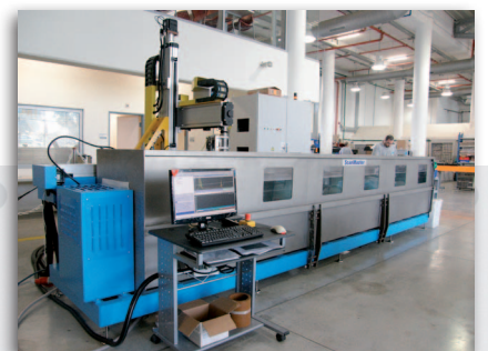
LS 200 für die Prüfung von Stangen und Rohren