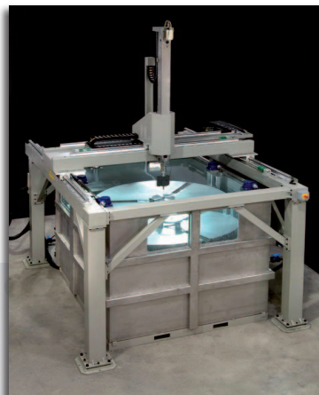
LS 200 ohne Hub-Plattform und mit großem Drehteller (Durchmesser 1500 mm)