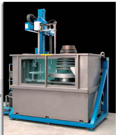
LS 200 LP mit Hub-Plattform und großem Drehteller (Durchmesser 1000 mm)