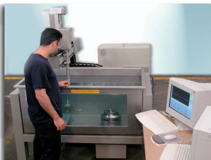
LS 500 mit kleinem Drehteller