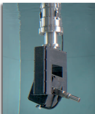
Zwei-Achsen a/b Prüfkopfmanipulator mit Kollisionsschutz (SafeGuard)

Große Justierplatte für Referenz- oder Kalibrier-Standards (500 x 600 mm / 20 x 24" bzw. 560 x 200 mm / 22 x 8", abhängig vom Systemtyp, Abmessungsänderungen möglich), inkl. zwei 90° Bezugskanten.